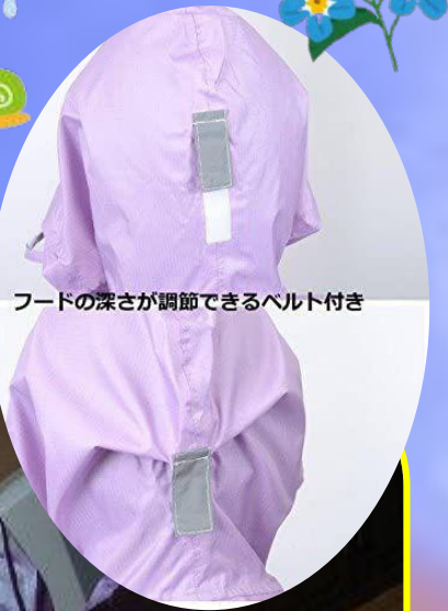
フードの深さが調節できるベルト付き