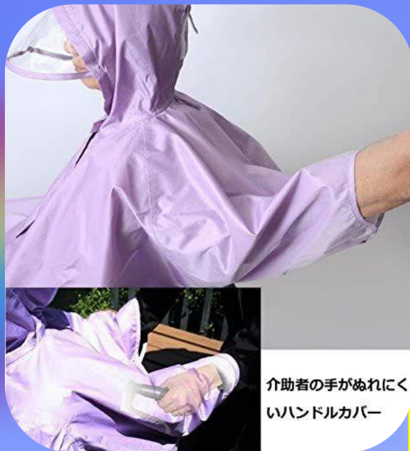
介助者の手がぬれにくい ハンドルカバー